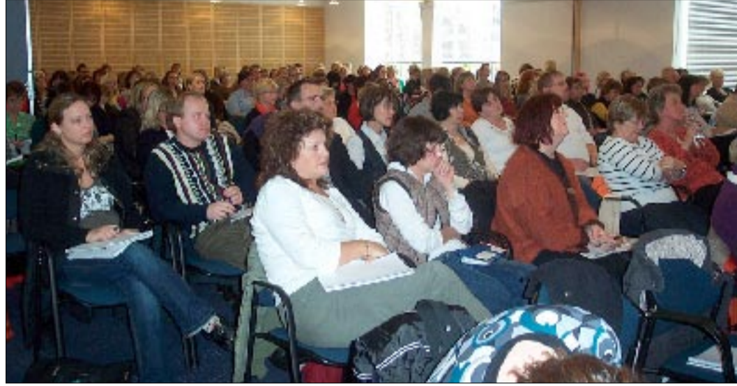
Das Interesse an der ADS-Fachtagung war wieder enorm groß.